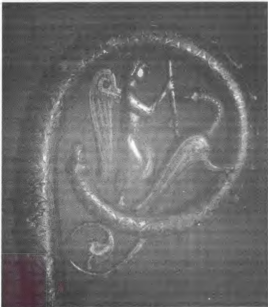
Esmalt excutat en la tècnica champlevé a Llemotges, segle XIII